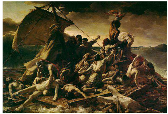
Le Radeau de la Méduse H. : 4,91 m ; L. : 7,16 m.

D'après « c'est pas sorcier » "restauration d'œuvre d'art"